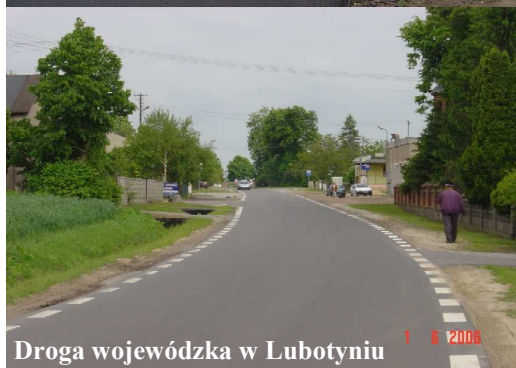
Droga wojewódzka w Lubotyniu